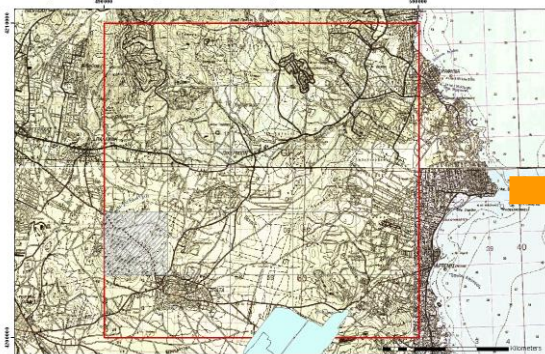
Αττική επιλεγμένο 2x2 (49/420 - 490/4202)