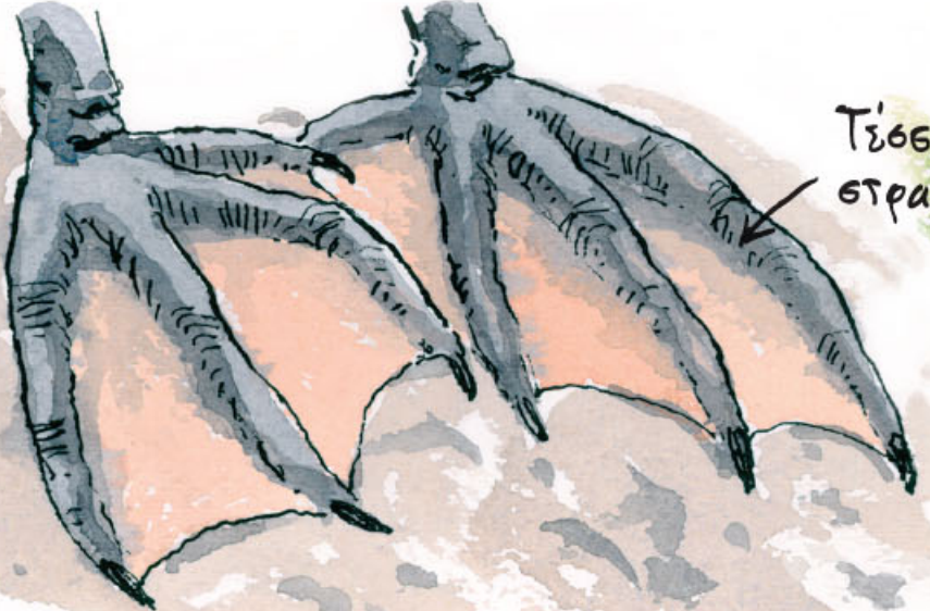
Τέσσερα δάχτυλα στραμμένα μπροστά