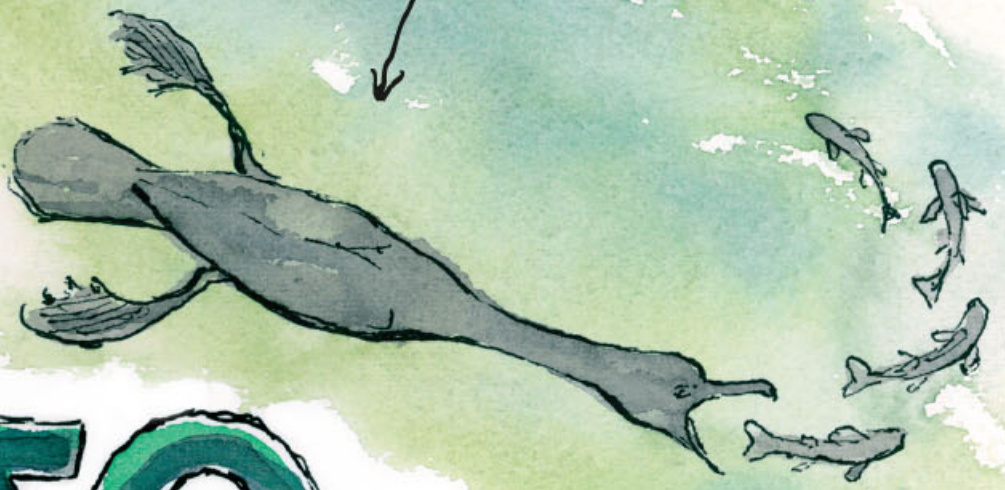
Ψαρεύει κοντά στο βυθό κωπηλατώντας με τα πόδια