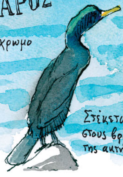
Στέκεται όρθιος στους βράχους της ακτής