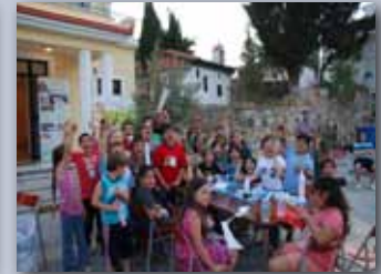
Εκδήλωση στους Φούρνους